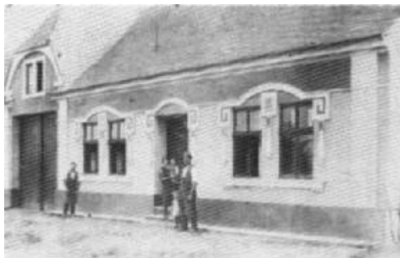
Haus Edmund Wieder in den 30ern

Aus dem Gespräch mit ihnen war zum Teil ihre Unzufriedenheit zu erkennen. In mein eigenes Haus ließ uns der scheinbar immer noch wüste Rohling (Wie 1945) nicht hinein, obzwar er zuhause war. So gingen wir nur außen rundherum. Die Kirche in Irritz ist ganz vereinsamt, hat keinen Priester. Der Friedhof vollkommen vernachlässigt, das Gras ist mannshoch. Nur einige Gräber sind von zurückgebliebenen Dorfbewohnern gepflegt.