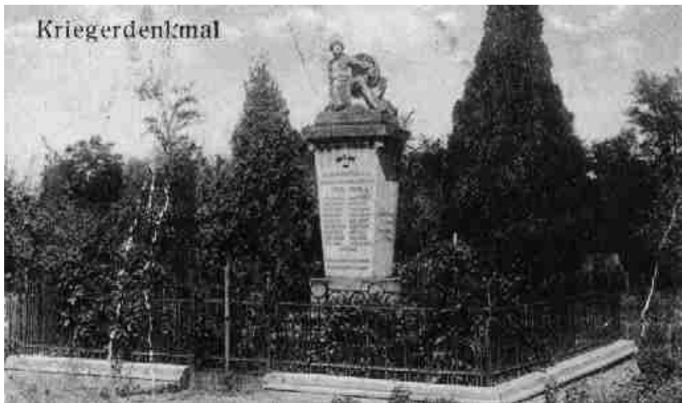
Das 1924 für die Gefallenen des Weltkrieges errichtete Kriegerdenkmal