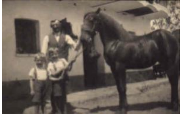
Bauernstolz: Pferde und Söhne

Auch dieser Großeinsatz dauerte 10 bis 12 Tage und schloß damit einen Höhepunkt der Jahresarbeiten ab. Die Schilderung der bisher aufgezählten Arbeiten wäre aber unvollständig, wenn wir nicht auch die fast übermenschliche Leistung der Bäuerin hier mit anführen würden.