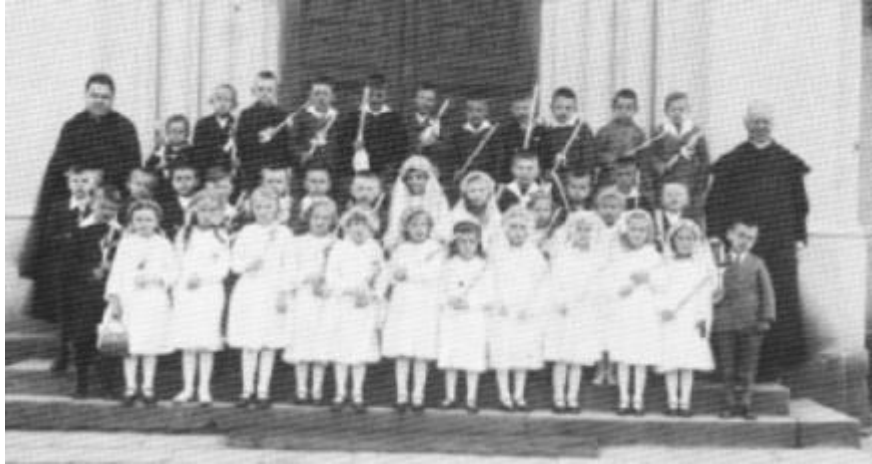
Erstkommunion Jahrgang 1930

Als Volksschüler mußten wir um die Pfingstzeit zur Beichte nach Irritz. Es war an einem vorsommerlichen Nachmittag, als wir, etwa 10 bis 15 Buben, die einsame Straße nach Irritz pilgerten - mit den allerbesten Vorsätzen.