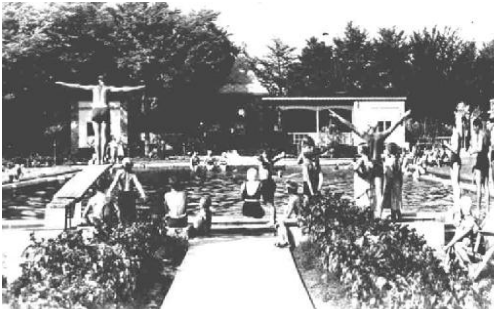
Cyrrill Zeihsel, links, demonstriert die Haltung beim Sprung ins Wasser

Unter seiner Leitung verwandelte sich in den Jahren 1929 bis 1931 das verwairstete hintere Dorfviertel völlig. Der Turn und Spielplatz wurde vergrößert, wertvolle Anlagen (für einen Kindergarten bestimmt) angelegt. Anstelle der alten Gänseschwemme entstand eine Freibad-Anlage, die in ihrer harmonisch abgestimmten Zusammenwirkung aller ihrer Einzelheiten, unstreitig zu einer der schönsten, weit und breit zählt. Es war keine Nachahmung, sondern eine Neuschöpfung. Einmalig war die